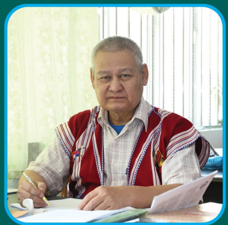
ပွၤလုၢ်ဒိၣ်ပွၤဒိၣ်သံၤလၢပွၤကဏ္ဍိချာထံသဂ္ဂျာနီၤပီၢ် ဆဂ္ဂုၢ်အိၣ်စီၤမိၤဒီးဆဂ္ဂုၢ်အိၣ်စူ ပွၤဆဲးဆဲးစုၤစုၤဒီးစုၤစုၤ